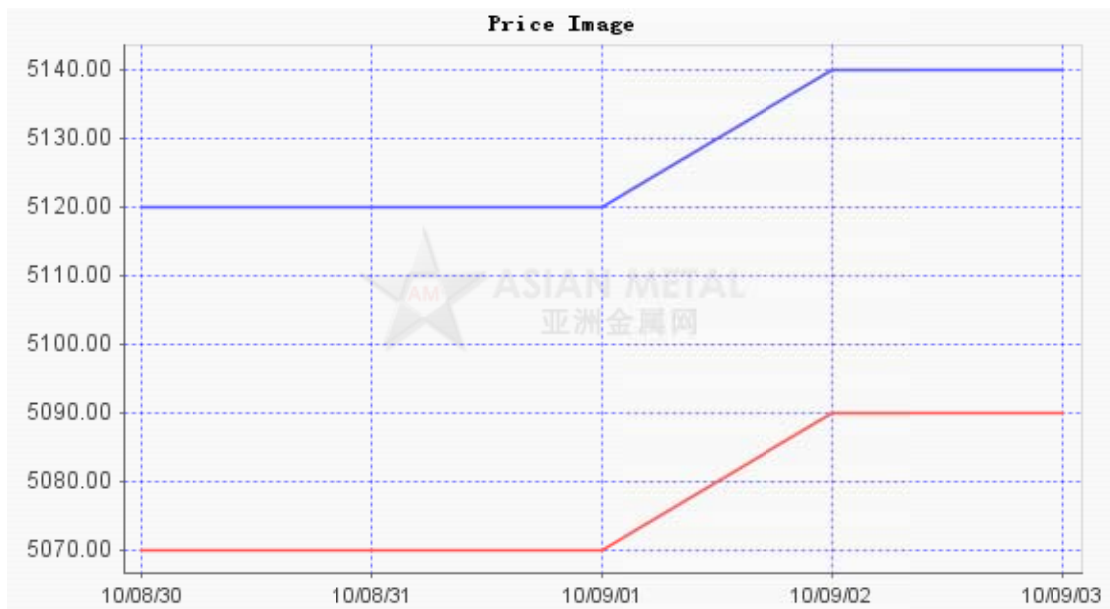
图一 (数据来源: 亚洲金属网)

本周国内冷轧卷市场小幅上涨,上海地区SPCC 1.0mm价格涨幅20元/吨,主流成交由5070-5120元/吨涨至5090-5140元/吨。